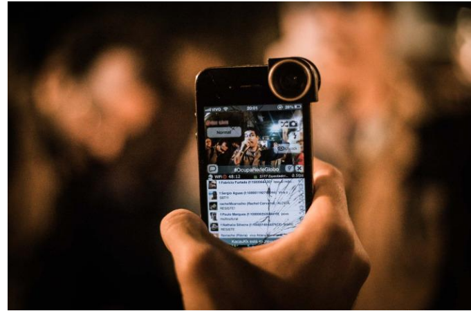
Transmissão em tempo real (atualmente)